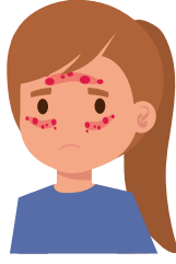
> ٢ سنة

تختلف الأعراض باختلاف العمر، ويمكن تمييز الأعراض عن طريق منطقة الإصابة، ففي حالة الرضع (> ٢ سنة)، تظهر الأعراض عادة على الخد والجبين وفروة الرأس والعنق والجذع واليدين، والذراعين، والقدمين. أما في حالة الأطفال (من ٢ إلى ١٢ سنة) والمراهقين والبالغين، تتأثر عادة الجهة الأمامية للعنق والطيات الداخلية للمرفقين وخلف الركبتين.